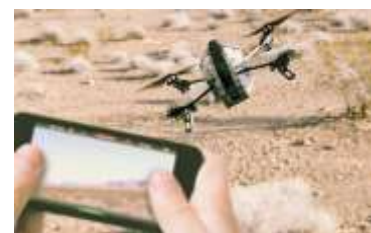
Pilota il robot Spazio Viterbi