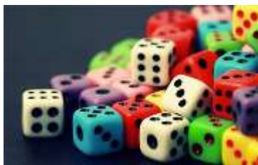
Impara per giocare, gioca per imparare Spazio Viterbi

Attraverso giochi stimolanti e divertenti potrai conoscere e approfondire gli aspetti matematici legati al gioco, in particolare quello d'azzardo, e svilupperai gli adeguati "anticorpi" per evitare di prendere decisioni sbagliate. Poi vestirai i panni dell'agente segreto. Ti sfideremo a decifrare messaggi rimasti inviolati per 1000 anni, ti daremo la possibilità di utilizzare la temibile macchina cifratrice ENIGMA, ricostruita fedelmente dai nostri studenti, e ti faremo capire perché il modo più sicuro per fare acquisti oggi è... Internet. Le attività proposte dagli studenti del Majorana saranno: I solidi platonici nel gioco dei dadi - Il paradosso del compleanno-anniversari coincidenti - Il dilemma di Monty Hall - Mazzetti misteriosi... e molto altro... - Una gara di decifratura di... libri molto famosi - La cifratura (e decifratura) di messaggi con la macchina Enigma - Scambiarsi un messaggio tra gli 'spioni' di Internet: la cifratura moderna.